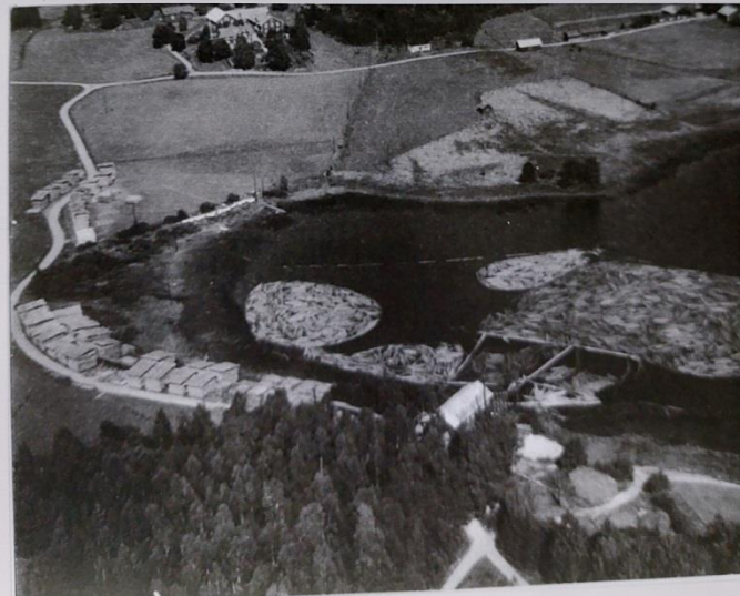
Flygfoto från 1954

Sedan köpte Per Schönning sågen och satte in en dieselmotor, men motorn frös sönder och på 1980-talet började han riva ut allt järn som kunde skrotas. Av sågen återstår idag bara ett tomt skal och enligt hörsågen måste marken saneras p. g. a. besprutning av virke på 1950-talet.