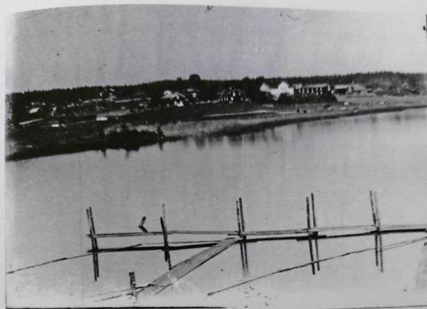
Utsikt från sågen i början av 1900-talet