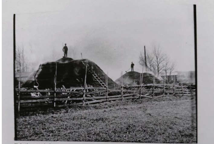
Kolmilorna vid sågen

När det sedan inte längre fanns avsättning för kol, såldes ribben till Ljusne Industrierna.