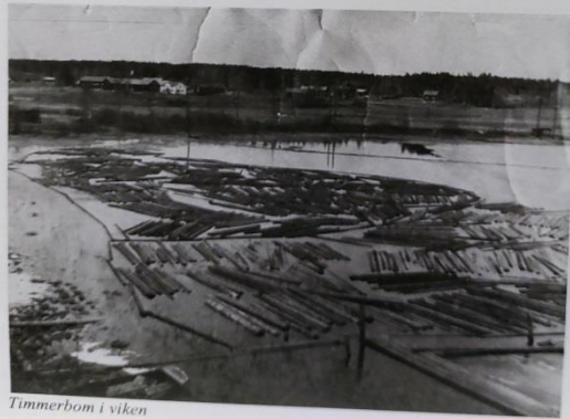
Timmerbom i viken