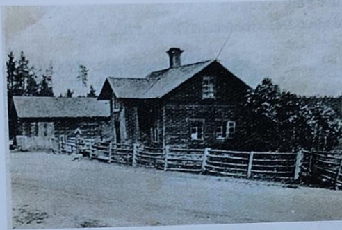
Landsvägstorpet omkring år 1940